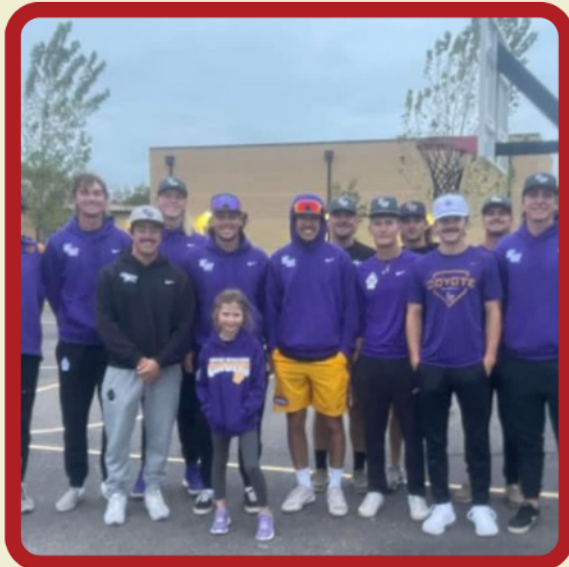
Kansas Wesleyan Football Team