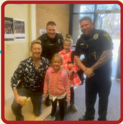
Salina Police Department