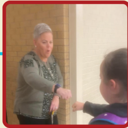
Bennington State Bank