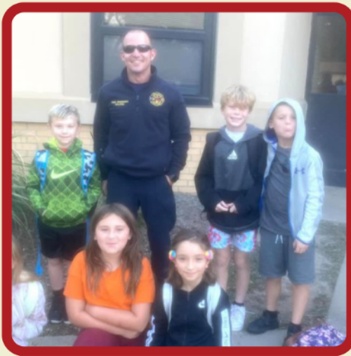
Salina Fire Department